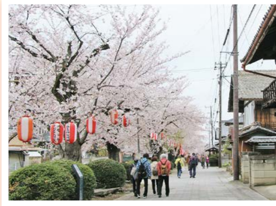
桜並木を歩く参加者

甘楽さくらウォークが4月4日に開催されました。約1,000人の参加者が満開の桜と春の花々が彩る町の名所旧跡を巡りました。小幡公園にはキッチンカーが並び、たくさんの方がウォーキング後の疲れを癒やしほっと一息つく姿が見られました。