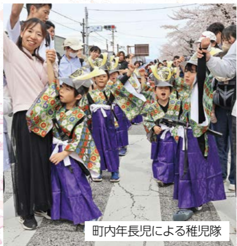
町内年長児による稚児隊