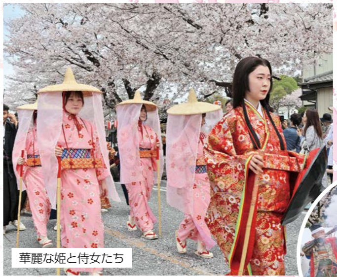
華麗な姫と侍女たち