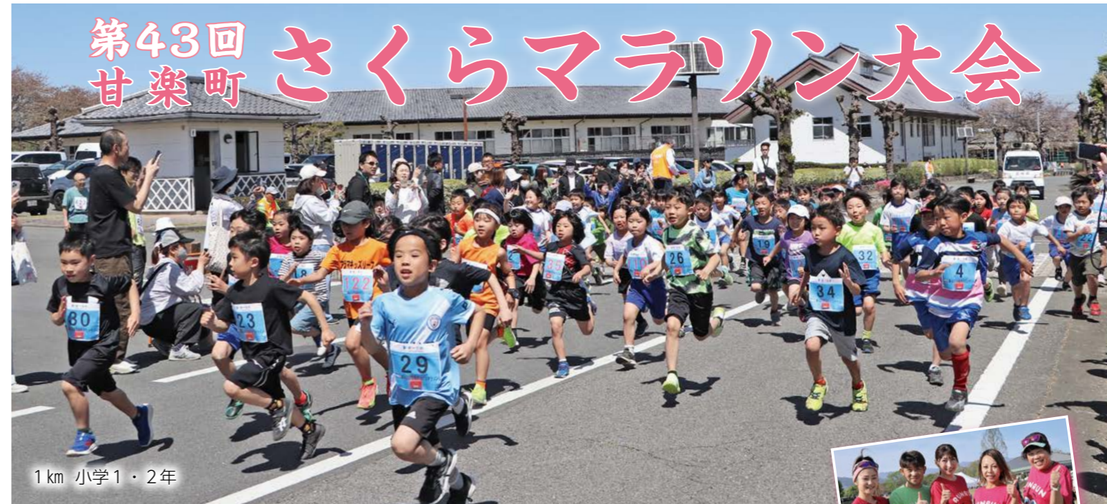
1 km 小学1・2年