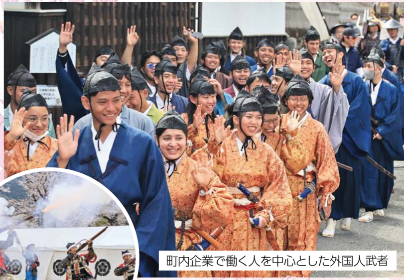
町内企業で働く人を中心とした外国人武者