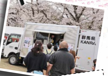
町のキッチンカーをお披露目