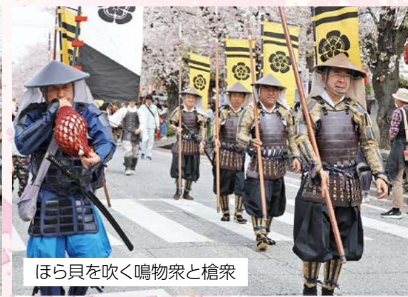
ほら貝を吹く鳴物衆と槍衆