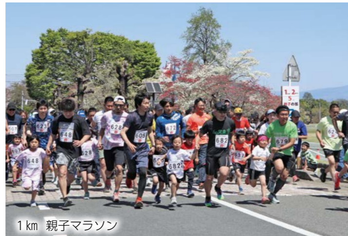
1 km 親子マラソン