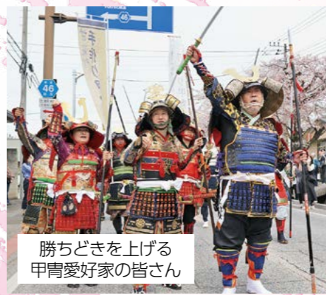
勝ちどきを上げる 甲冑愛好家の皆さん