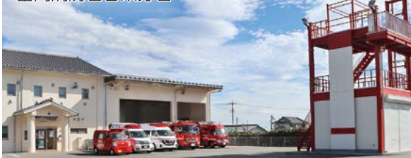
富岡消防署甘楽分署