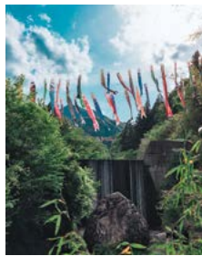
『鯉のぼりが舞う、春の里山。』