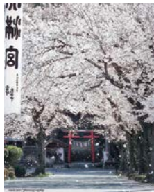
『サクラノキオク』 (meicam_cu_iさん)