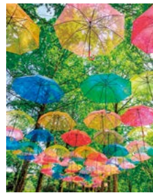
『新緑におどるアンブレラスカイ』