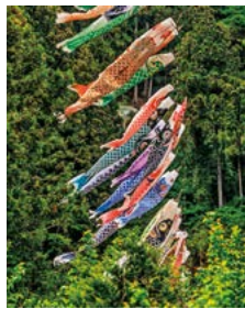
『Rising 鯉のぼり』 (abarta112さん)