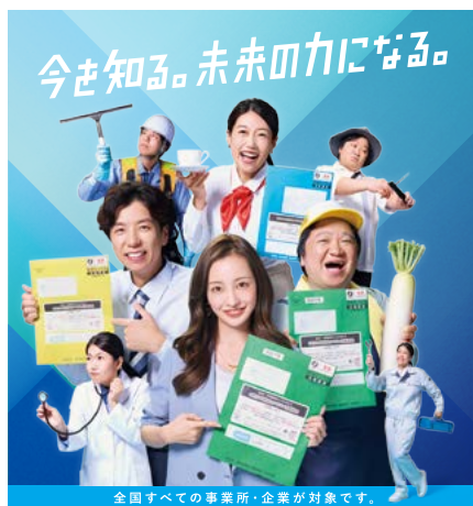
全国すべての事業所・企業が対象です。