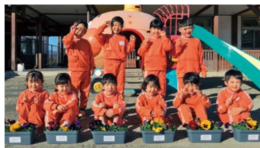
◀めぶきの森幼稚園 ▶かんな保育園