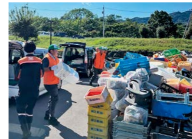
硬質プラスチック