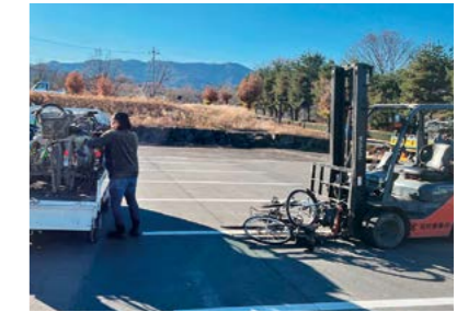
古タイヤ・廃バッテリー・自転車