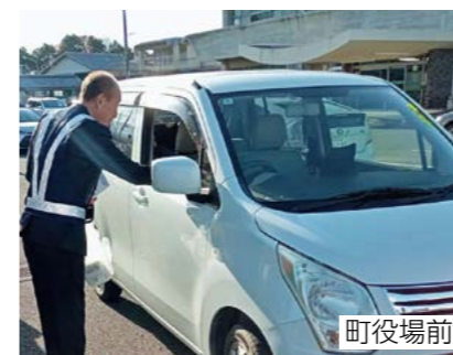
町役場前 ドライバーにチラシや啓発品を配り、交通安全運動を周知しました。