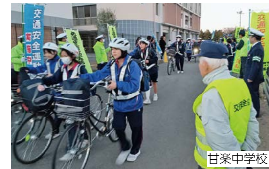
甘藷中学校 下校時に反射ベストの着用指導と自転車の安全な利用について啓発を行いました。

「夕暮れ時における早めのライト点灯と反射材の着用促進」「自転車の交通事故防止と飲酒運転の根絶」を重点目標にした冬の県民交通安全運動が実施され、警察、交通安全協会、町交通指導隊などが交通安全を呼び掛けました。