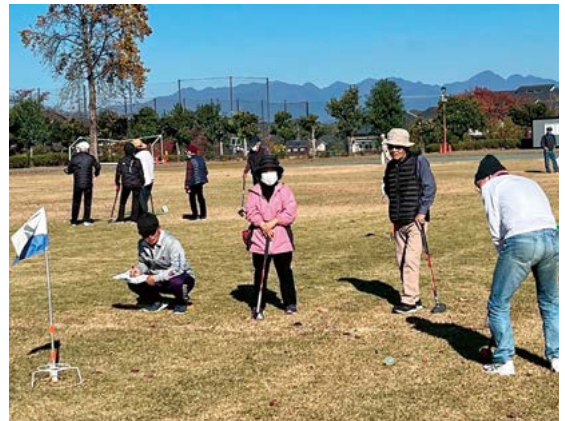
仲間の声援を受けながらプレーする参加者