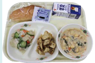
12月8日の献立 (みそスチュー・とうのいものみそがらめ・きくいものナムル)

有機農業推進法の成立・施行から10周年を記念して、2016年に制定されました。町では有機野菜を使った給食を通して、農業の多様性や自然環境の大切さを学んでいます。