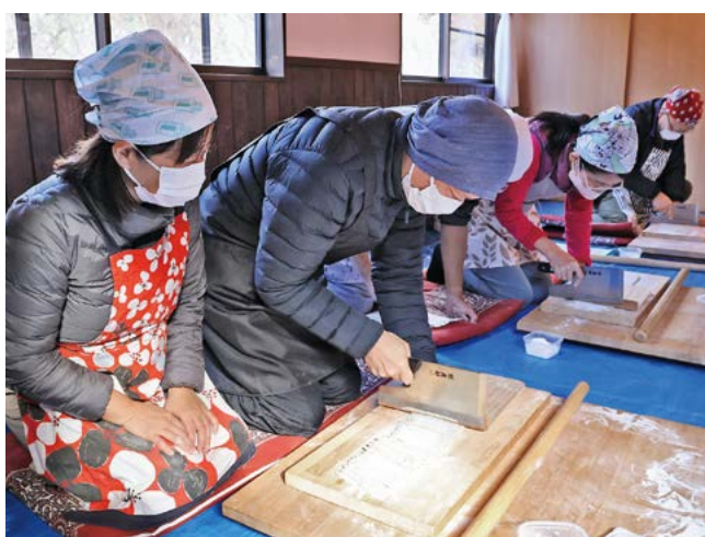
協力しながら蕎麦打ち工程を楽しむ参加者

「蕎麦づくり入門」の締めくくりとなる蕎麦打ち体験は12月12日から14日、那須庵で行われました。