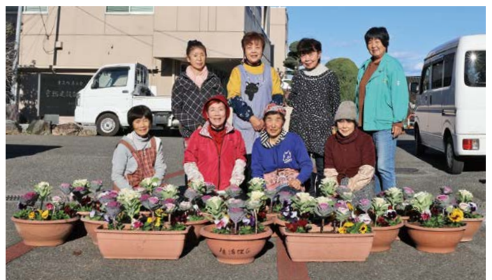
生活改善グループの皆さん

会長は「花を見ると自然と笑顔になります。皆さんが新しい年を気持ちよく迎えられるように心を込めて植え替えました」と話されました。