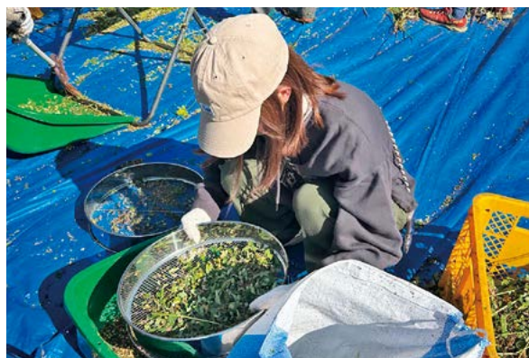
丁寧にふるいをかける参加者

オーナーの皆さんは、それぞれの畑でそばの実を刈り取り、足踏み脱穀機で脱穀した後、ふるいを使って3回にわたり選別を行い、最後に袋詰めまでの工程を仕上げました。