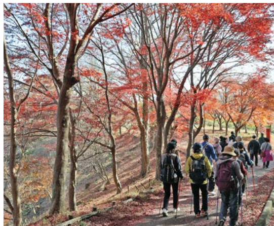
紅葉が美しい紅葉山を歩く参加者

秋晴れの下、紅葉が彩る景色を楽しみながら「どど実タルト」や「なめこ汁」で食欲の秋も満喫しました。