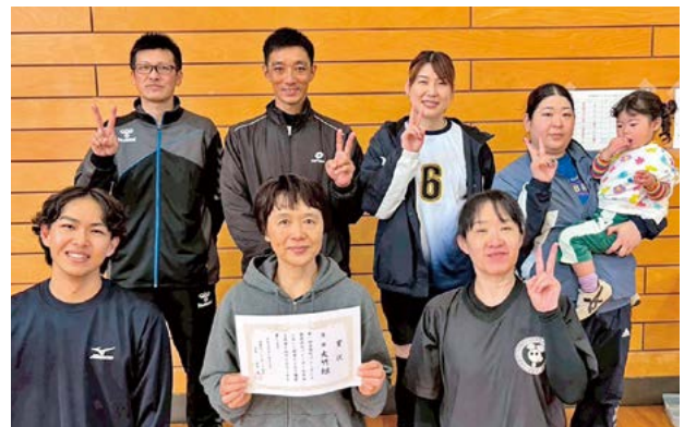
優勝した大竹組の皆さん

6チームによる総当たり戦の結果、福島地区のメンバーで構成された「大竹組」が見事優勝しました。