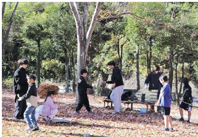
秋の自然を楽しむ参加者と学生ボランティア