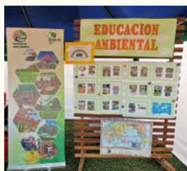
写真展示を通じて地球規模のつながりを発信