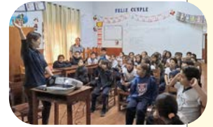
▲クイズで楽しく勉強！

私は市内の学校でプレゼンテーションを重ね、子どもたちに環境問題やごみの分別について伝えてきました。知るだけでなく、日常の習慣とし