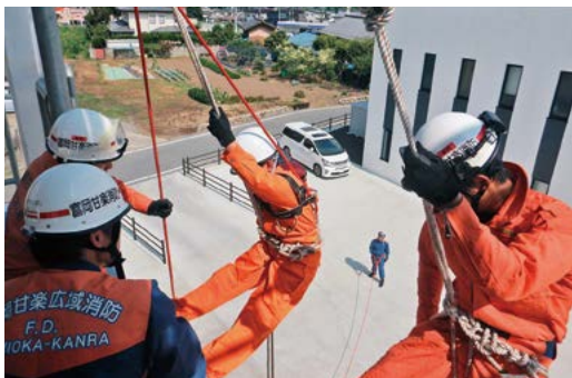
慎重に降下の準備をする参加児童

「1泊2日消防士体験」が8月16・17日、富岡甘楽広域消防本部にて行われ、抽選で選ばれた富岡市甘楽郡内の小学校に通う5・6年生5人が参加しました。出動時の見学をはじめ、消防車両への搭乗、濃煙室内での検索、放水、登はん、降下訓練の体験、また、夕食はカレーを自炊するなど貴重な学びの体験となりました。