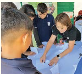
「ここは山折り」と丁寧なサポートで紙飛行機作り