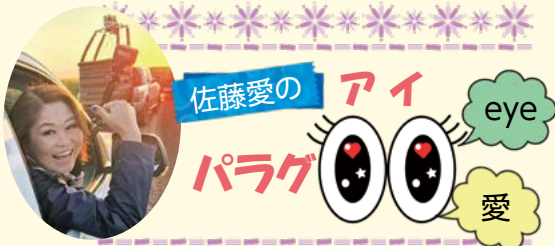
▲朝日とともに熱気球フェスティバル会場へ出発！