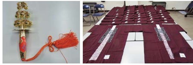
整備した祭事用品の一部

このように宝くじの収益金は、身近な地域コミュニティ活動の発展に活用されています。