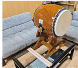
上写真：はんてん 左上写真：神楽鈴 左写真：長胴太鼓