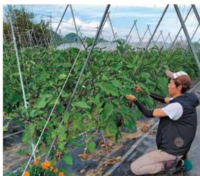
研修先でナスの栽培管理を学ぶ

法を学びました。また、園内の畑では40品目ほどの秋冬野菜の栽培にも挑戦。虫や獣に野菜を食べられたり、強風や雪でマルチやビニールトンネルが壊れたり、自然の厳しさにも直面しました。