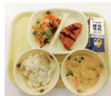
有機米と味噌スチュー

ージが担当者の努力により、大変充実しています。 ●和食や全国の郷土料理、交流国にちなんだメニューを取り入れるなど食文化への理解が深まっています。