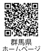
群馬県ホームページ

道路沿いの樹木の伐採にご協力を願います 私有地の竹や木の枝が、車両や歩行者の通行の妨げになっていることがあります。道路沿い