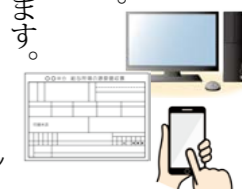
マイナポータル連携