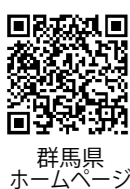
群馬県ホームページ

詳しくは左記の2次元コードを確認ください。 問合せ 群馬県県土整備部砂防課 ☎027-226-3633