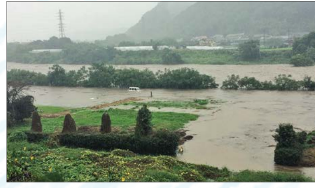
令和元年台風19号で増水した鍋川(福島)