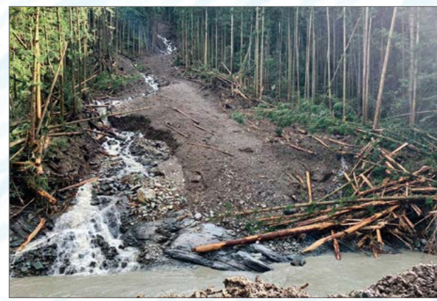
令和元年台風19号による土砂崩れ(秋畑)