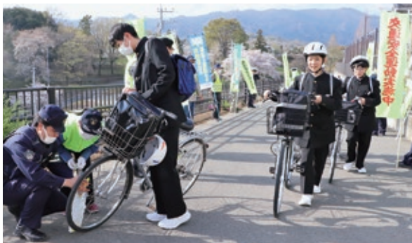
自転車に反射材を取り付け交通事故防止を呼び掛け