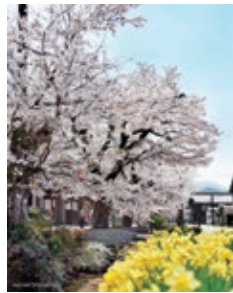
『サクラノキオク』 (meicam_cu_iさん)