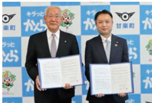
協定書を交わす同社オペレーション本部 群馬・栃木ゾーン高家ゾーンマネジャー(右)と茂原町長

これは、日ごろから町民が利用する機会の多いセブンイレブンの店舗が子どもや高齢者などの支援を必要とする人たちの見守り拠点となり、町と協力・連携して地域福祉の向上を目指す取り組みです。