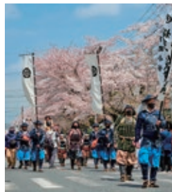
『武者行列』 (塚越智之さん)