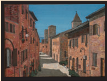
「チエルタルドの夢」

11月3～26日まで長岡今朝吉記念ギャラリーで開催する「甘楽町・チエルタルド市友好親善姉妹都市協定締結40周年記念2人展」で作品が観覧できます。 善意に深く感謝し、広く皆さんにお知らせします。