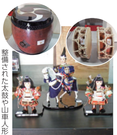
整備された太鼓や山車人形