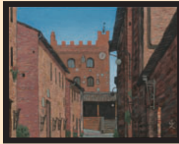
「チエルタルドの午後」