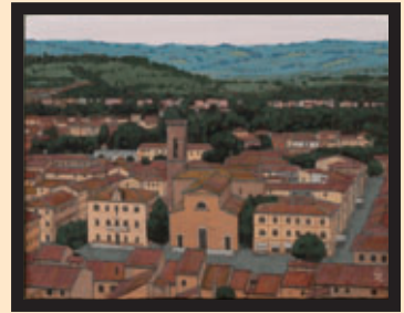
「チエルタルドの風」