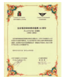
▲交流30周年記念の 共同宣言