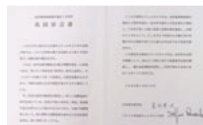
▶交流20周年記念の 共同宣言