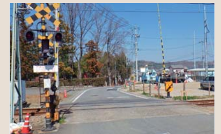
県道金井高崎線道路改良工事に伴い、新屋駅から堰口橋にかけて配水管の布設替工事をしています。