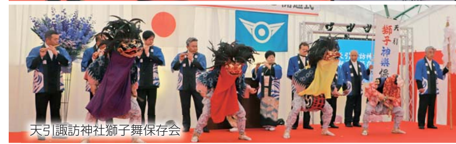
天引諏訪神社獅子舞保存会