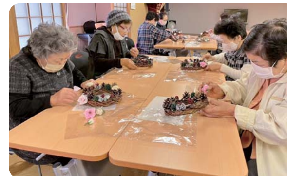
クリスマスリースを作成しました。「自宅でクリスマスを楽しもう！」

地域の人が集まって顔が見える場なので、参加者の健康や、人と人とのつながりを大切にこれからも活動を続けていきたいです。参加者は随時募集しています。お気軽にご参加ください。