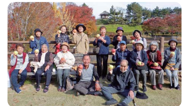
リンゴ狩りに出掛けました。「私とリンゴどっちが可愛い?！」

皆さんにとって楽しい場でありたい、そして地域に自分の居場所があれば、支える仲間づくりができ、地域の活性化にもつながると思います。