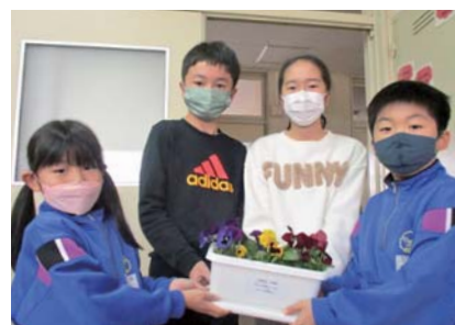
◀▶ 小幡小学校 新屋小学校