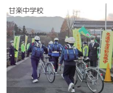
甘楽中学校 下校時に反射ベストの着用指導と自転車の安全な利用について啓発を行いました。

「子どもと高齢者の交通事故防止」夕暮れ時の早めのライト点灯と反射材などの着用促進「飲酒運転などの悪質・危険な運転の根絶」を重点目標にした冬の県民交通安全運動が実施され、警察、交通安全協会、町交通指導隊などが交通安全を呼び掛けました。