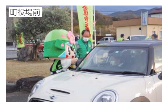
町役場前 シートベルトやチャイルドシートの着用指導と啓発品を配布し安全運転を呼び掛けました。