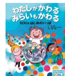
原 琴乃・作 MAKOオケスタ ジオ・イラスト 山田基靖・監修 汐文社

続いて「わたしがかわるみらいもかわる」の読み聞かせ。この絵本は、小さい子にもSDGsがわかるように作られています。小さい子にわかるということは、誰にでもわかるということです。「難しいな」というハードルを一気に飛び越えることができたようで、会場の雰囲気ぐっつり和みました。