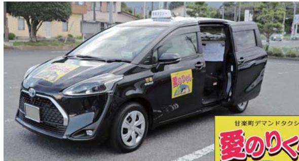
スライドドアで乗り降りしやすい車両