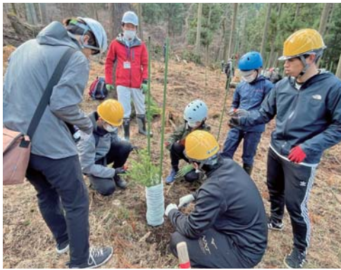
環境意識を育む植林活動

また、授業後の26日には町有林でスギの植林体験が行われ、学生と6年生、プロジェクト委員約50人が参加し豊かな水と森の関係性について学習する貴重な機会となりました。