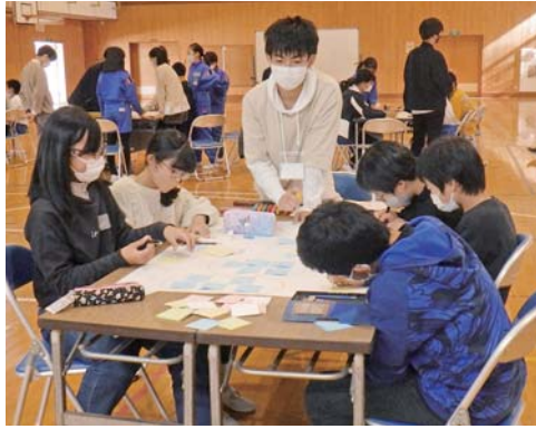
新屋小学校での交流授業

町では令和3年7月「甘楽の天然水商品化プロジェクト委員会」を立ち上げ、「かんらの天水」の商品化を契機に産官学民一体となり、水資源を中心とした森林保全、観光振興、教育の推進に取り組んでいます。