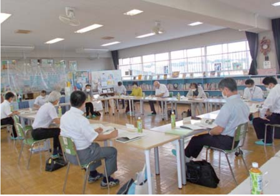
第3回学校運営協議会

学校は地域の方々との協力を得やすく、地域の方々にとっては子どもたちとの関わりが増えて、地