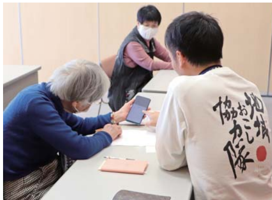
個々の悩みにも対応しています

前向きな心持ち・姿勢が未来を明るくしていきます。スマホ操作のお悩みを解消するのはもちろんのこと、「分からない」ことへの不安や恐れ・面倒くさいをどのようにしてワクワクに変えていけるか。