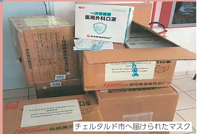
チェルタルド市へ届けられたマスク

コロナ禍の2020(令和2)年春には、マスク不足に陥ったチェルタルド市に対し、町とハルビン市が協力しマスクを届けるなど、新たな協力体制が生まれました。