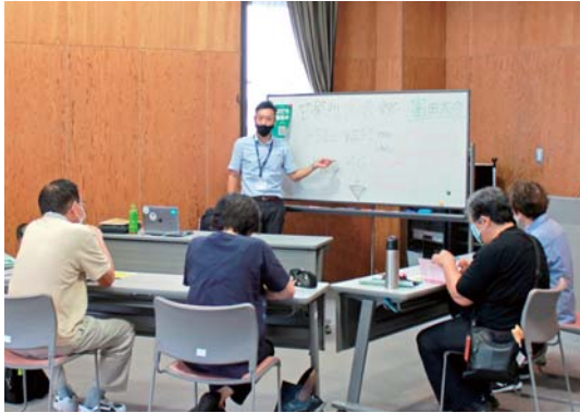
スマホの設定方法なども説明しています

町からは、インターネットなどの情報通信技術を使える人と使えない人の間に生じる「デジタルデバイド(情報格差)を埋める」ということを期待されており、現在は2種類のスマートフォン教室を中心に活動をしています。