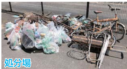
ごみゼロの日 搬入量調べ