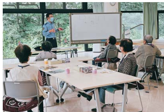
富岡警察署交通係長の講話に耳を傾けるミニデイサービス利用者の皆さん

30日には、高齢者交通安全教室がにこにこ甘楽でミニデイサービス利用者を対象に行われ、道路横断時の注意点や反射材着用の必要性について啓発し、交通安全に対する意識の向上を図りました。