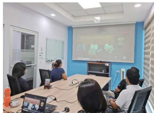
甘楽町からのメッセージを視聴するスタッフたち

引き続き、甘楽町とニカラグアの関係を維持しつつ、お互いの交流を深めていくことができたらと思います。