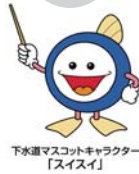
下水道マスコットキャラクター「スイスイ」