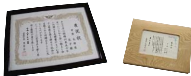
慶祝状は、額(左)と写真たて(右)のいずれかを選べます。

町内に引き続き5年以上お住まいのご夫婦であれば、婚姻の届出後50年が経過した日から、いつでも申請できます。詳しくは、健康課福祉係(にここ甘案内)へお問い合わせください。