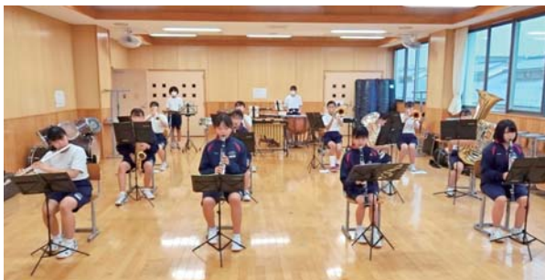
音楽室で演奏する吹奏楽部の皆さん

記念式典のニカラグアと日本の文化交流コーナーに、甘楽中学校吹奏楽部1・2年生が動画出演しました。