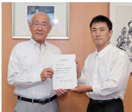
茂原町長から委嘱状を交付された妻木さん（右）