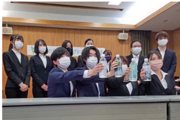
プロジェクトに参加した学生の皆さん