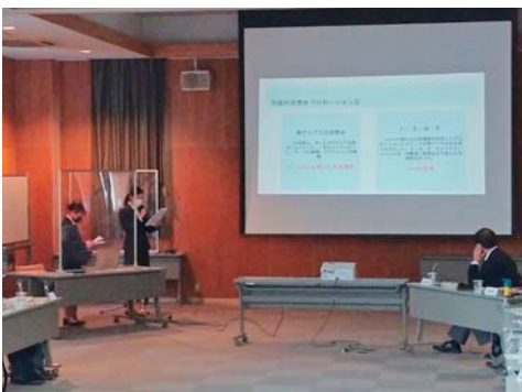
委員会での学生の発表

また、7月25日の第2回委員会では、アンケート調査の結果報告とラベルデザインの決定が行われました。