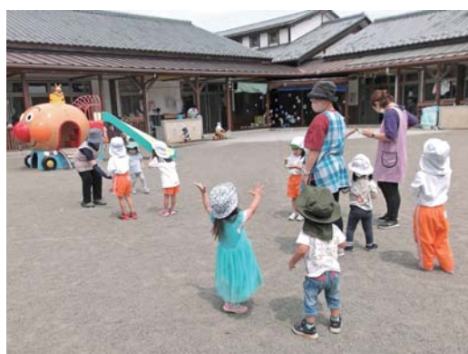
園庭でのびのび遊ぶ子どもたち

県内初となる公私連携型保育所の開園に向けて連携・協力し、多様化する保護者ニーズへの対応や保育サービスの充実を図ります。