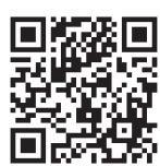
群馬県デジタル窓口