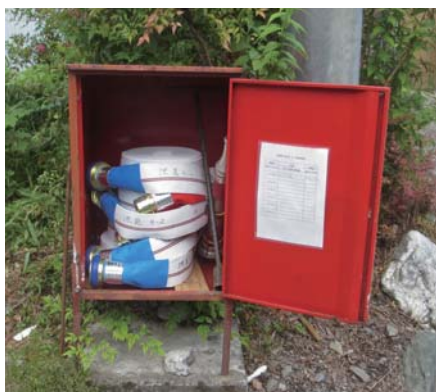
第11区の消火栓用ホース