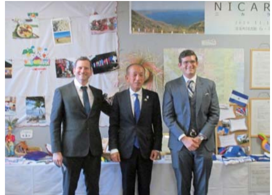
昨年11月に初来町したヴィバス公使参事官(右)。ロドリゴ・コロネル前駐日ニカラグア特命全権大使(左)、森平副町長とニカラグア展を視察されました。