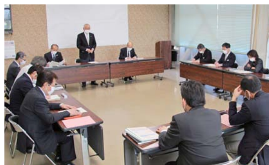
第3回新型コロナウイルス対策本部会議(3月19日)