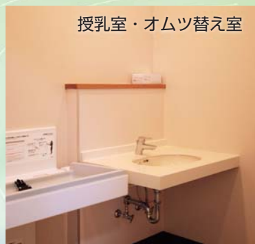
授乳室・オムツ替え室