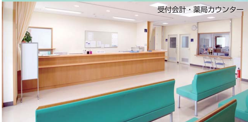
受付会計・薬局カウンター