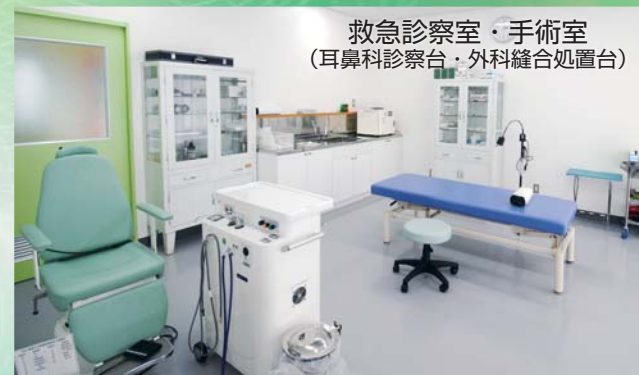
救急診察室・手術室 (耳鼻科診察台・外科縫合処置台)