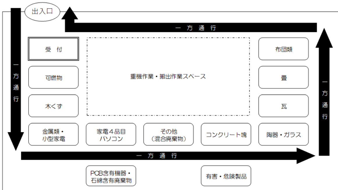
図2 仮置場の配置イメージ図

なお、図2で示すような複数の「ごみの山」を集積する規模の用地確保が困難な場合は、町内に複数仮置場を設置して、集積する「ごみの山」の種類を区分するように取組みます