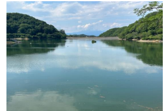
【大塩貯水池からの流出口】