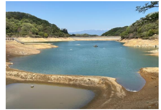
【大塩貯水池からの流出口】