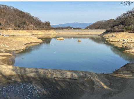
【大塩貯水池からの流出口】