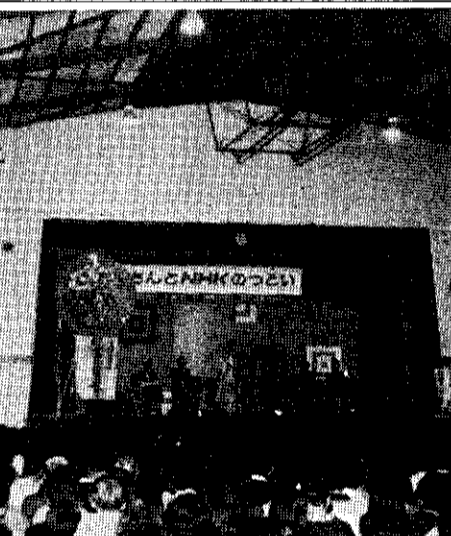
写真は二中体育館で開かれたプレゼントショー

敬老会が開かれました。町の社会福祉協議会が主催したもので、七十五才以上のおとしより四百七人をお招きしました。この日は、おとしよりを各地区からバスで迎え、町