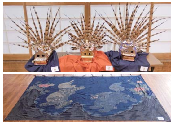
整備した那須獅子舞保存会の獅子頭(写真上)と緞帳

第11区では、このコミュニティ助成事業により那須獅子舞保存会の獅子頭(3頭)と緞帳を修繕しました。このように宝くじの収益金は、身近な地域コミュニティ活動の発展に活用されています。