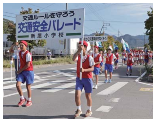
新屋小児童による交通安全パレード