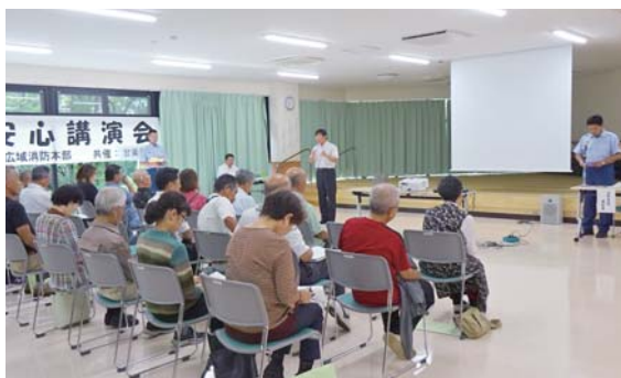
手話通訳付きで実施された講演会

聴覚障害者手帳所持者、民生委員、区長など21人が参加し、災害時の行動や災害への備えなどを確認しました。