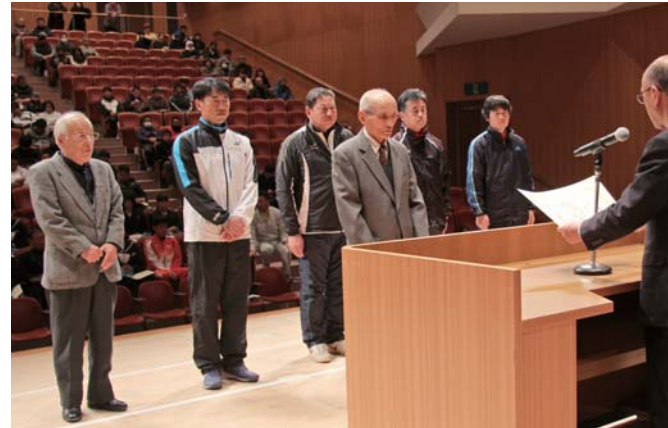
スポーツ功労者の皆さん