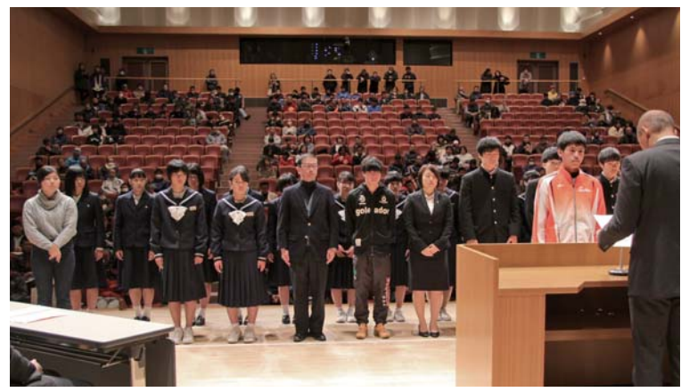
県・関東・全国大会で活躍された年度優秀選手の皆さん