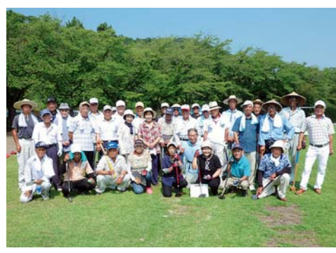
グラウンドゴルフ大会に参加した会員の皆さん

◎ 会員相互の交流を図るため、互助会活動も行っています(バーベキュー、グラウンドゴルフ、親睦旅行など)。