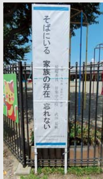
標語看板(かんら保育園)