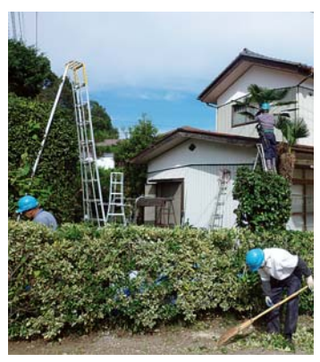
植木の剪定もおまかせ

☆ 公共的な団体ですので、収益を目的としていません。安心して仕事を任せください。 ☆ 高齢者が働きますので、危険・有害な作業はお引き受けできません。