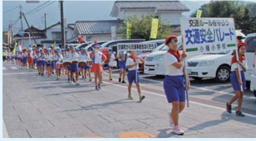
(小幡小学校) 昨年の交通安全パレード

◆福島小学校交通安全パレードのお知らせ 日時: 9月21日(金) 午後2時から 福島小学校 ⇒ 甘楽庵山ぐち付近交差点