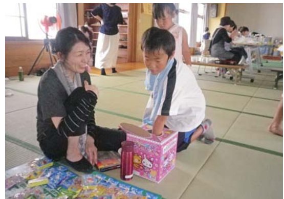
くじ引きを楽しむ子どもたち

今回は、地元子どもたちに加えて、おたっしや会「庭谷サロン」の皆さんも参加し、住民約70人が七夕飾りやバーベキューなどで恒例の夏祭りを楽しみました。