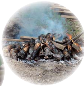
①タケノコを皮付きのまま丸焼きに

甘楽ふるさと館で「タケノコの大名焼き」が開催されました。新緑が美しいゴールデンウィークの2日間に約200人が参加しました。参加者は轟みそがたっぷりだった焼きたてのタケノコやニジマスの塩焼きなどを味わいながら、手品や南京玉すだれの実演などを楽しみました。最後にはお楽しみ抽選会も行われ、甘楽の春を満喫しました。