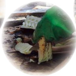
②焼きたてのタケノコの皮をむいてカット