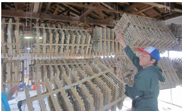
お蚕を振り込んだ回転まぶしをつるす作業(昨年6月)

活動始めは、「地域おこし協力隊というからには、地域全体と向き合っていかなければ」と意気込んでいたのですが、その不自然な気負いを見透かされたのでしようか、「地域という漠然とした言葉にのまれて、一人ひとりとの人付き合いをおざなりにしていないか」と指摘されたことがあります。それから、地域という言葉に翻弄(ほんろう)されないように意識しながら、甘楽町の人たちとお付き合いすることで、本やインターネットからは得られないようなたくさんのことを学ぶことができました。 そして今、学んでいるだけでは許されない時分が差し迫ってきました。甘楽町での自立のために、たくさんの人から教えていただいたことを仕事に発揮していきたいような一年にしていきたいと思えます。