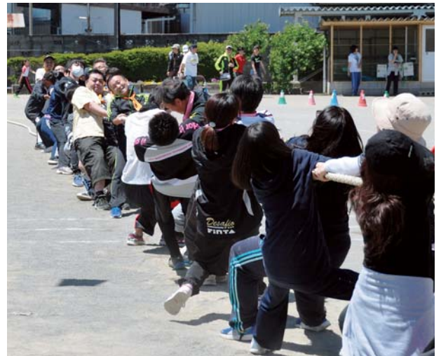
↑声援を受け、白熱した戦いを繰り広げた綱引き ←躍動感あふれる障害物競走