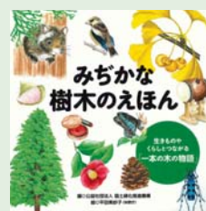
みちかな樹木のえほん 国土緑化推進機構 編/ ポプラ社