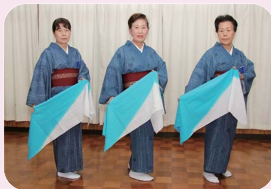
きらの会「島のブルース」

会の名前は「きら」と「初音」に分かれましたが、行動を共にして、練習や施設慰問、芸能発表会、カラオケ大会などに参加し、和気あいあいと楽しく活動しています。