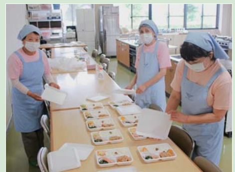
ボランティアの皆さんが週3回在宅給食サービスの調理・配達を行っています