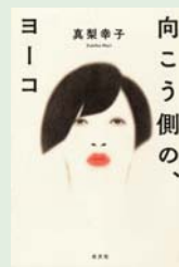
向こう側の、ヨーコ 真梨幸子 著/光文社