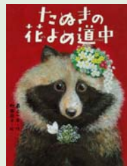
たぬきの花よめ道中 最上一平 作/岩崎書店