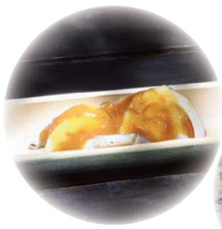
③手作りの竹の器に盛りつけ、特製みそダレをかけてできあがり