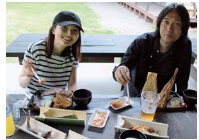
↑新鮮なタケノコなど春の味覚を堪能した参加者 ←甘楽南京玉すだれ芸友会の皆さんと一緒に皿回しに挑戦