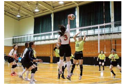
小幡クラブ VS 王子クラブ