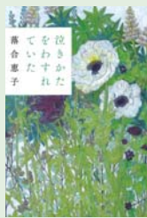
泣きかたをわすれていた 落合 恵子 著/河出書房新社