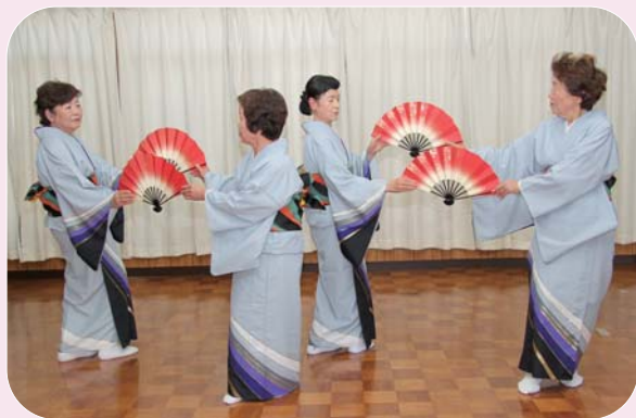
初音会「お久しぶりね」