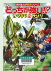
どっちが強い!? カマキリVSサンリ スライム、イカロス ストーリー/ KADOKAWA