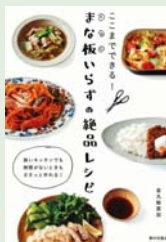
ここまでできる！まな板 いらすの絶品レシピ 金丸 絵里加 著/家の光協会