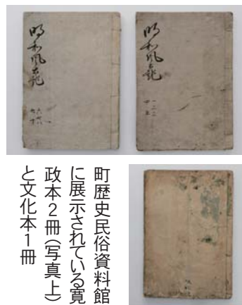
町歴史民俗資料館に展示されている寛政本2冊(写真上)と文化本1冊

『明和風土記』の原作者、年代は不明です。寛政本は、寛政10年(1798)12月の年号が書かれている上下2冊の筆写本です。文化本は、文化5年(1808)9月の年号がある1冊の筆写本です。