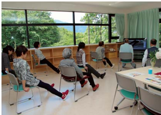
新緑を眺めながらストレッチ体操

高齢者が気軽に立ち寄れる「にこにこサロン」を毎週月曜日の午前中、にこにこ甘楽内の地域包括支援センターで開いています。 お茶やコーヒーを飲みながら、おしゃべりや昔あそび、将棋などの趣味をボランティアと一緒に楽しんでいます。 また、ストレッチ体操をしたり、生活や介護の相談も行っています。