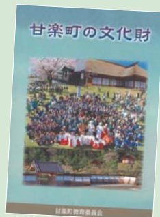
『甘楽町の文化財』(マップ付き)定価500円

既指定文化財99件に、平成30年1月、追加指定の文化財9件と国重要無形文化財保持者(人間国宝)須田賢司氏、日本遺産などを反映、写真入りで解説した『甘楽町の文化財』とその所在地を示す『甘楽町文化財マップ』の改訂版を刊行しました。