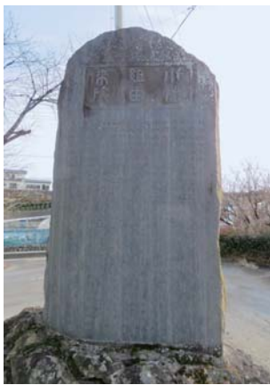
甘楽富岡農業協同組合甘楽支所(福島)内に建立

大正6年(1917)3月、甘楽社小幡組組合員が協議し、組合の歴史を後世に伝え、ますますの隆盛を図るために本碑を建てました。 高さ80cmの台石上にあり、碑高1.94m、幅1.02m、厚さ15cm、石材は黒御影石です。碑文を訳すと「邑ニ養蚕セザルノ家ナク製絲セザルノ婦ナシ」となり、村中が養蚕に携わり、製糸をしない女性はいなかったことが理解できます。当地域の養蚕業をけん引してきた甘楽社小幡組の歴史を伝える貴重な由来碑です。