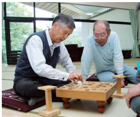
真剣なまなごしで将棋の対決

日時 毎週月曜日(祝日除く) 午前9時～正午 場所 にこにこ甘楽 地域包括支援センター 対象 町内に住む65歳以上の入