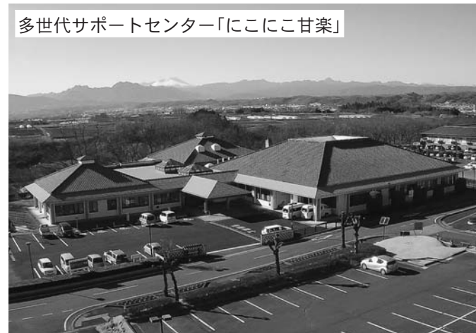
多世代サポートセンター「にこにこ甘楽」