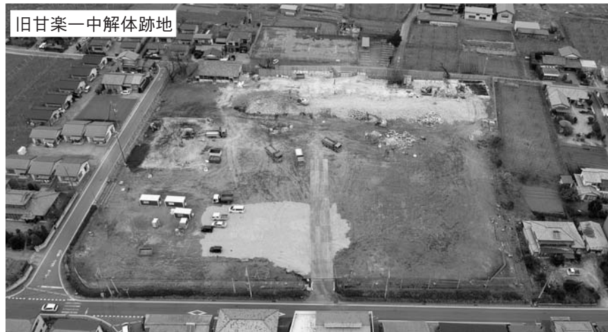
旧甘楽一中解体跡地

地域の特色や独自性を発揮した地方創生を推進し、住んでいる町民の皆さんや町を訪れるすべての人が「キラッと輝ける」予算編成をこれからも進めていきます。