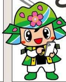
甘楽町キャラクターかんらちゃん