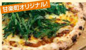
轟みそピザ(※春菊) 926円(税込1,000円)