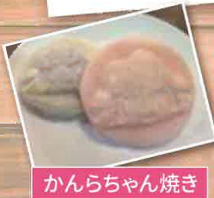
かんらちゃん焼き