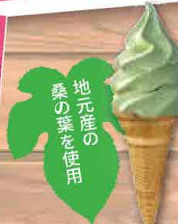
桑茶ソフトクリーム