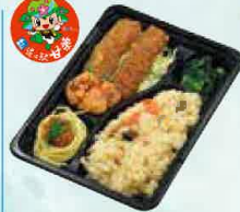
かんらちゃん弁当 500円(税込540円)