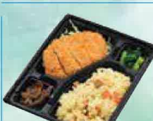
ロースカツ弁当 602円(税込650円)