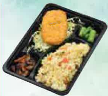
コロッケ弁当 500円(税込540円)