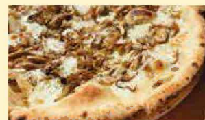
きのこピザ 1,204円(税込1,300円)