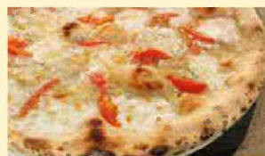
ミニトマトとゴルゴンゾーラ 1,297円(税込1,400円)