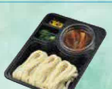
田舎うどん 334円(税込360円)