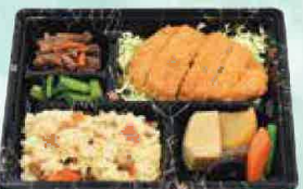
桃太郎弁当(煮物とロースカツ) 843円(税込910円)