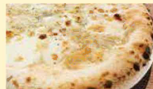
クワトロフォルマッジ 1,204円(税込1,300円)