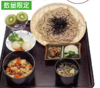
キジそば定食 1,637円(税込1,800円)