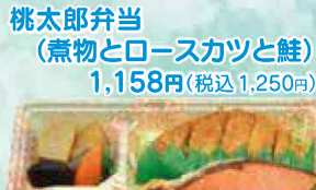
桃太郎弁当(煮物とロースカツと鮭) 1,158円(税込1,250円)