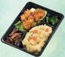
唐揚げ弁当 528円(税込570円)