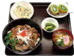
上州牛焼肉定食 1,455円(税込1,600円)