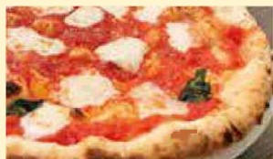
マルゲリータ 1,019円(税込1,100円)