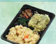
いそべ揚げ弁当 463円(税込500円)