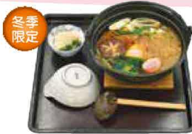
鍋焼きうどん 1,182円(税込1,300円)