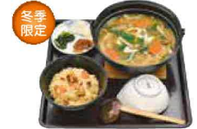
お切り込み定食 1,364円(税込1,500円)