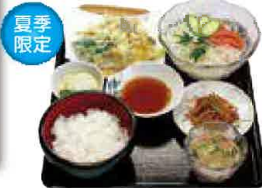
せせらぎ定食 1,182円(税込1,300円)