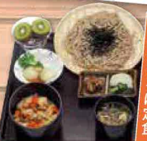
名物キジそば定食