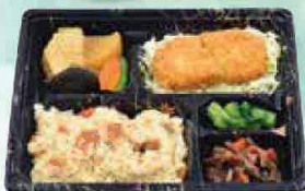
桃太郎弁当(煮物とコロッケ) 732円(税込790円)