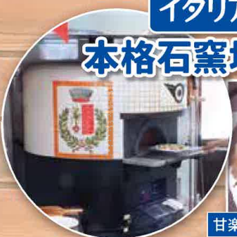
甘楽町オリジナル 轟みそピザ