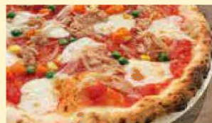
ツナ入りマルゲリータ 1,112円(税込1,200円)