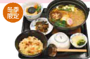
鍋焼きうどん定食 1,637円(税込1,800円)