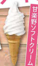
甘楽ソフトクリーム