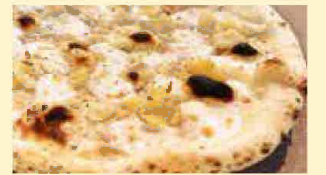
ポテトとモッツァレラ 1,112円(税込1,200円)