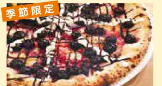
季節のドルチェピザ(※リンコ) 1,204円(税込1,300円)