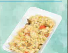
桃太郎ごはん 334円(税込360円)