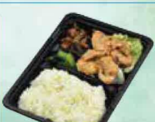
豚ロース弁当 500円(税込540円)