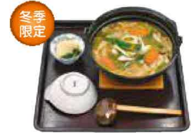
お切り込み 1,091円(税込1,200円)