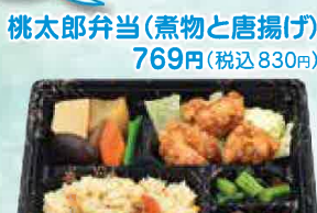
桃太郎弁当(煮物と唐揚げ) 769円(税込830円)