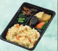
煮物弁当 500円(税込540円)