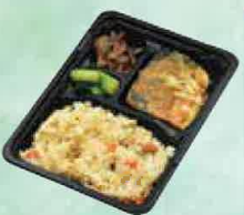
サバの味噌煮弁当 528円(税込570円)