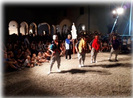
三匹獅子とカンカチ（案内役）