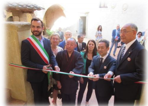
展覧会テープカット