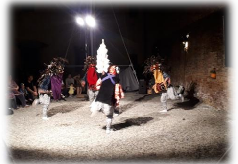
1日2回公演を3日間に渡り披露