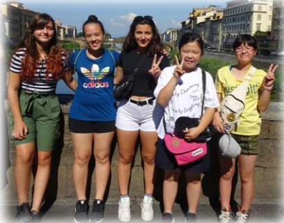
8/18 フィルツィ合同見学

研修団員たちは、今回の研修で異国の歴史や文化に肌で触れ、イタリアの生活習慣を学びました。また、チェルタルド市滞在中に心と心が触れ合う友情を育んだことは、中学生にとって素晴らしい経験であり、今後の人生の上で大きな財産になったことでしょう。