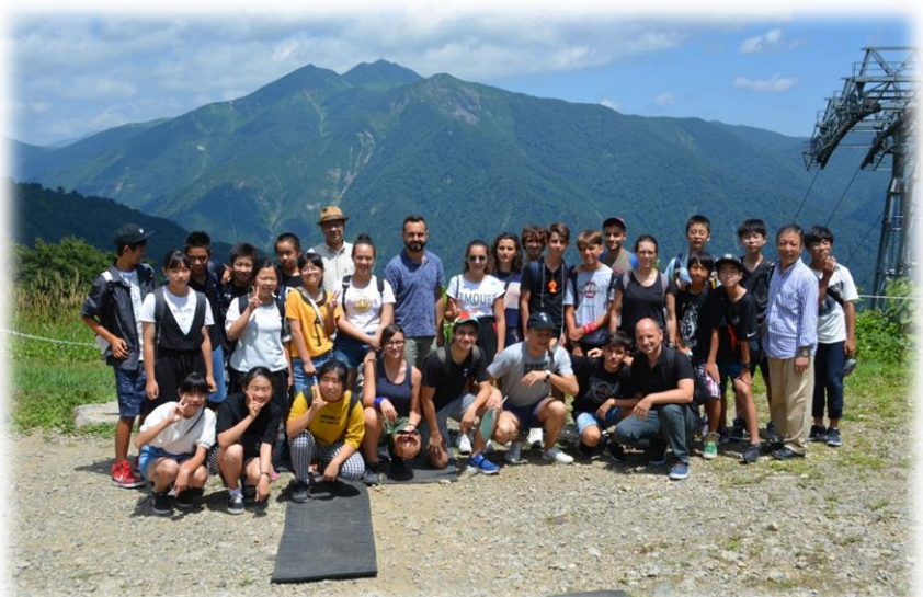
山並みを背景に両市町使節団の皆さんで(谷川岳ロープウェイ)