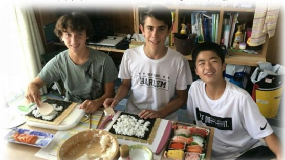
ホームステイ受入家庭で手巻き寿司に挑戦