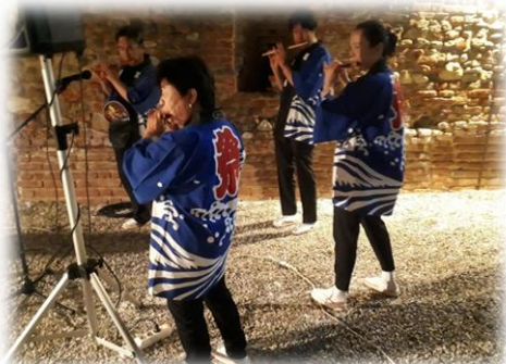
笛の音が会場に響き渡ります