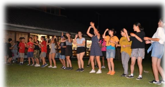
甘楽町滞在最後の夜にみんなでダンス!

チェルタルド市青年使節団は、甘楽町滞在期間中に培った友好の絆を胸に、2週間後のチェルタルド市での再会を約束して帰国しました。甘楽町研修団員にとってもイタリア訪問前の交流は大きな経験となりました。