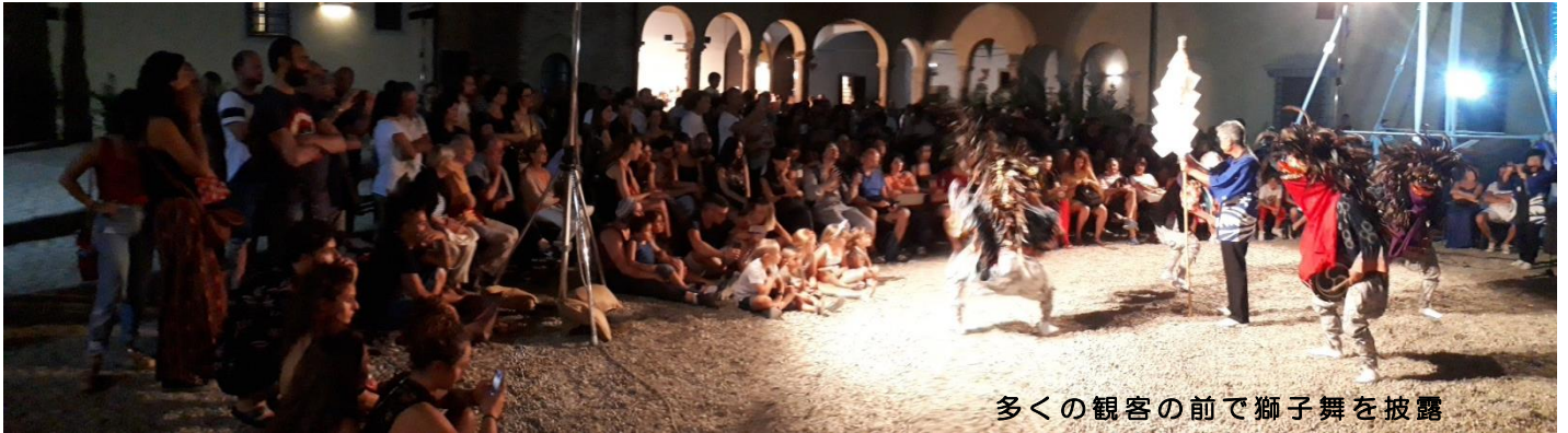
多くの観客の前で獅子舞を披露

チェルタルド市との姉妹都市協定締結35周年を記念して、同市で開催される「メルカンティア」に出演するため、獅子舞使節団（天引獅子神楽舞保存会の皆さん9人）が派遣されました。使節団は7月9日から16日までの8日間イタリアを訪問し、町指定重要無形民俗文化財の獅子舞を披露しました。