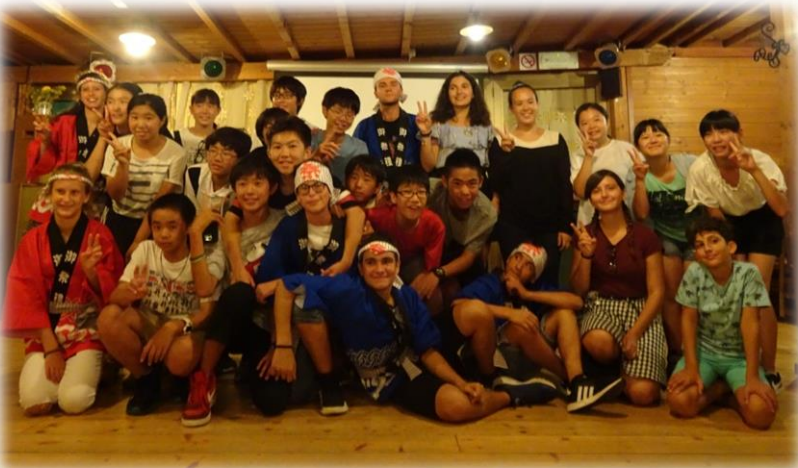
8/21 お別れ夕食会での1枚