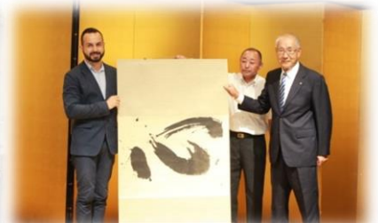
祝賀会にてチェ市へ「心」を贈呈