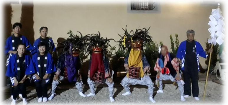
天引獅子神楽舞保存会の皆さん

今年で31回目の開催となる国際大道芸の祭典で、毎年7月中旬に5日間にわたって開催されます。1993年には甘楽町芸能使節団が出演し、能や舞踊を披露しました。