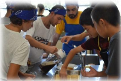
ティラミス作りに没頭中