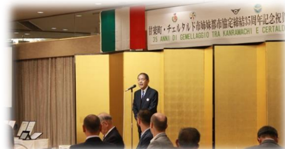
祝賀会での長岡理事長挨拶