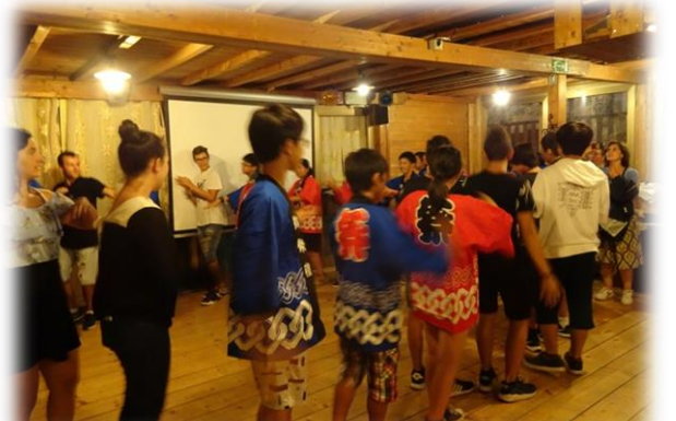
8/21 みんなで甘楽町音頭