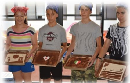
最後の仕上げはチェ市の皆さんで