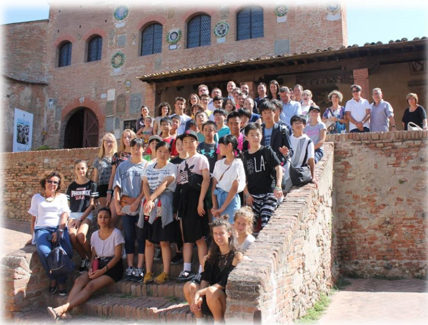
8/17 プレトリオ宮殿でチェルタルド市の皆さんと

第17次チェルタルド市訪問中学生国際交流研修団（22名）をチェルタルド市へ派遣しました。今回の研修団は、8月14日（火）から24日（金）の間、9泊11日の日程でイタリアを訪問しました。団員は滞在期間中、チェルタルド市の一般家庭にホームステイをさせていただきました。