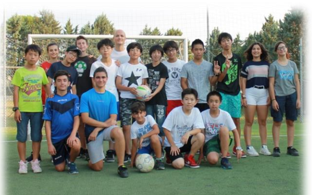
8/19 副市長が発起人！サッカー交流会