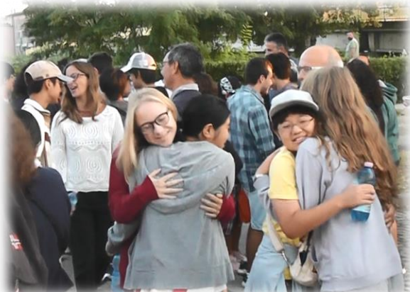
8/22 チェルタルド市出発の朝