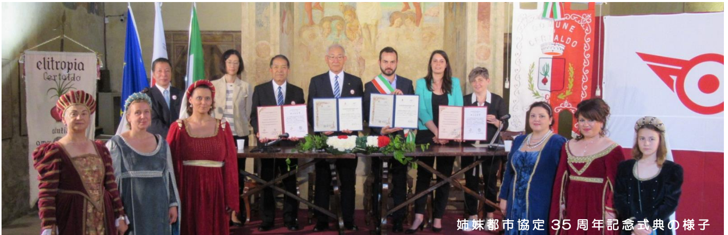
姉妹都市協定 35 周年記念式典の様子