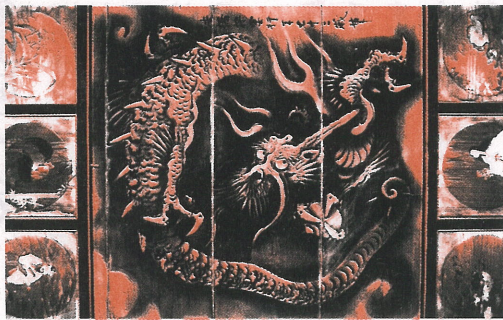
小幡八幡宮拝殿の天井画

開の可能性とすれば小幡八幡宮の行事や、町のイベントに合わせたの公開がまず実現出来ればと考えます。