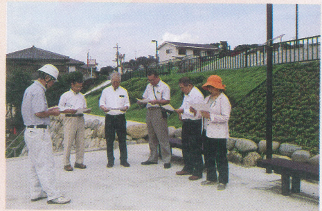
小幡公園修景整備工事