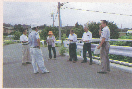
下之宿橋橋梁 補修工事(天引)