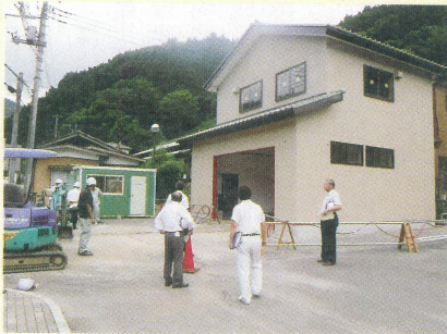
消防団消防施設 建築工事(秋畑)