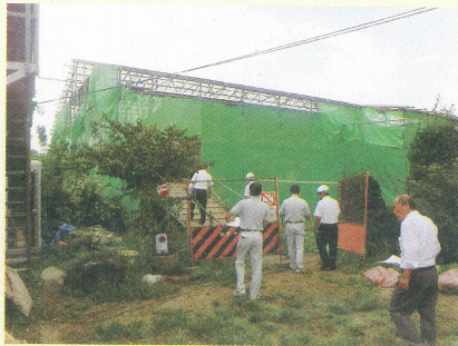
旧小幡藩武家屋敷 松浦氏屋敷主屋復原工事