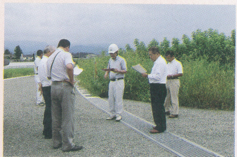
町道天神北金井1号線 整備工事