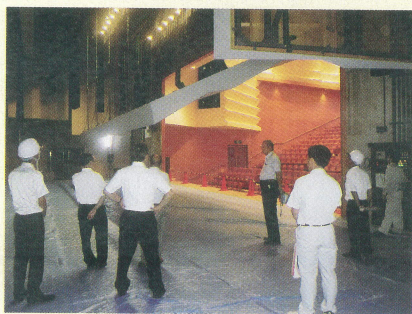
甘楽町文化会館空調設備 ・舞台吊物装置改修工事