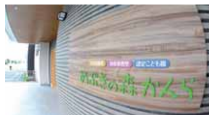
公私連携幼保連携型認定こども園 めぶきの森かんら 落成式 ※表紙の説明は10ページをご覧ください。

公私連携幼保連携型認定こども園…幼稚園と保育園の機能を合わせた施設で、連携して良質な幼児教育・保育を提供するために設置運営者と町は運営に関する協定を締結しています。