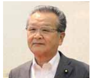
金田 倍視 議員