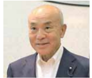
白石 豊樹 議員