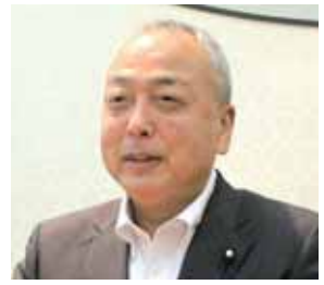
山田 光男 議員