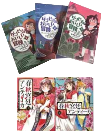
町図書館の蔵書より

■町長 ①町で確認している2名の漫画家の方にアドバイスをいただきながら、今後検討していきたいと考えています。 ②町独自の漫画コンクールを開催すると明言できる機運や土壌はできていないため、段階を踏んで検討するべきものと考えます。 ③新たなキャラクターの募集は今のところ考えていません。 ④「まんが甘楽町の歴史」は平成6年に刊行され、それ以降の情報は載っていない状況です。70周年に記念事業を計画することになれば、その中で検討を進めていきたいと考えています。