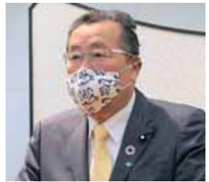
山田 邦彦 議員