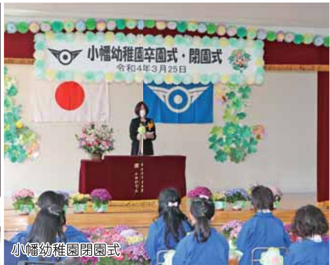
小幡幼稚園閉園式