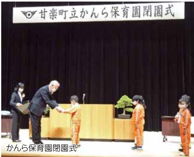
かんら保育園閉園式