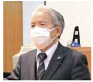
堀口 博 議員