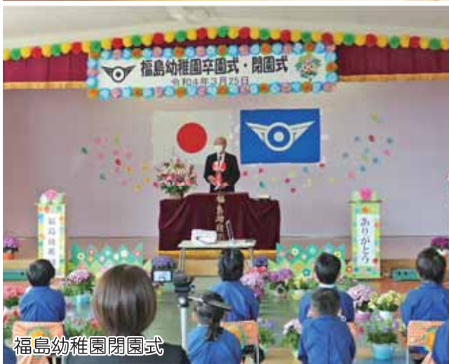
福島幼稚園閉園式