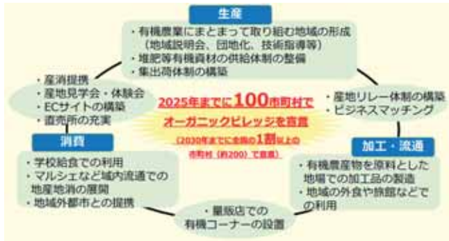
農林水産省資料より

■議員 農産を摂ったとしても「有機食品で浄化できる」(有機食5日間で54%減、1か月で94%減)との実験結果があります。 1日1食ミネラルと、ファイトケミカルたっぷりの有機給食に変える(例・学校給食)だけで体温が上がる⇒免疫力が強くなる。事も実証例があります。 ①現在、有機の米、食材はどのくらいか。 ②「オーガニック ビレッジ宣言」をしては。 ③学校給食に有機米を100%使用しては…残菜が激減とのこと。 ④米以外の食材も有機を使うことが大事です。行っているかどうか。 ■町長 ①有機米は使用していません。米以外の有機食材(野菜)の令和3年度年間使用量は25kgで、重さの割合は野菜年間使用量全体の0.1%程度となります。 ②宣言をするにあたっての内容を十分精査し、取り組みの可能性も踏まえて、町内農業従事者やJAなどの関係者と研究をしていきたいと思っています。 ③町内を含む周辺地域では有機米は生産されていません。地産地消推進のため、町内産のお 米を引き続き100%使用していきます。 ④関係課で連携し、有機農業の振興を図り、有機食材の使用が増えていくように取り組みます。