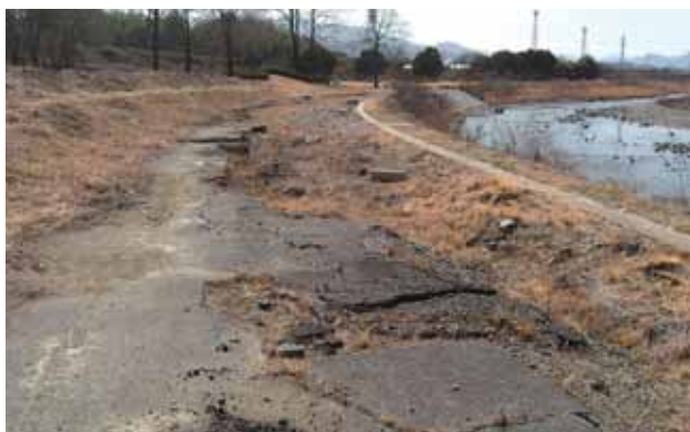
現在の旧福島河川緑地広場

■議員 福島河川敷は台風19号の豪雨で鐮川の氾濫による大量の土砂と流木が堆積する被害を受けました。現在は護岸改修工事は終了していますがグラウンドや芝生広場として使用されていた場所は今なお、数十センチからの川砂が堆積したままです。平常時の河川敷は適度な運動の場であったり近隣区による河川清掃、どんど焼き等にも使われ維持されてきた面もあります。 ①最近では不法投棄も確認されていますので、きれいに整備されてはいかがですか。 ②河川の堆積土砂撤去に特化した、期限付き制度を要請し、復旧を急いではいかがでしょうか。 ■町長 ①ゴミ捨て禁止の看板などを立てて注意喚起を行っていますが、人目が届かない場所もあるのでバリケード設置や見回りなどを検討します。 ②総務省の財政支援制度の事業対象となるには、県の河川維持管理計画で緊急に実施する箇所位置付けられる必要があります。 現在、鐮川は対象河川になっていないため制度の活用ができない状況です。 旧河川緑地広場の今後の管理方法など については、河川の管理者である県と協議・検討していきたいと考えています。