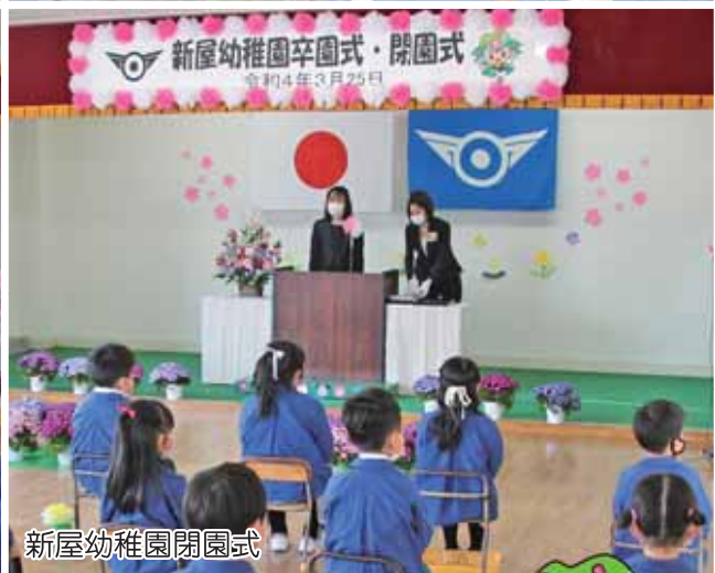
新屋幼稚園閉園式